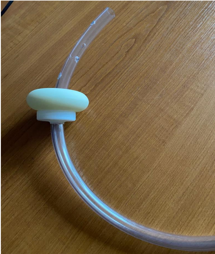
Рис.2. Вакуумна системи низького тиску в зборі й готова до використання після пологів через природні шляхи.

3. Завдяки створенню герметичного контуру на рівні шийки матки в порожнині матки формується стабільний негативний тиск за допомогою електричного медичного відсмоктувача «Біомед», модель 7А-23D (рис. 3). Герметичність системи є одним із ключових факторів ефективності методу, оскільки забезпечує підтримання необхідного рівня вакууму в порожнині матки та створює умови для реалізації гемостатичного механізму дії вакуумної системи низького тиску.