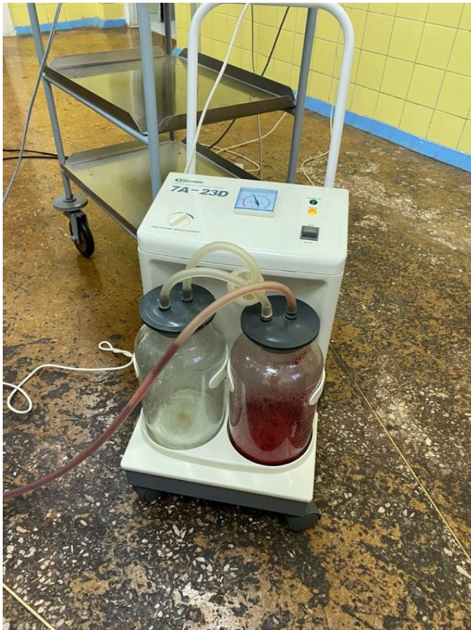
Рис.3. «Медичний відсмоктувач «БІОМЕД» електричний, модель 7А-23D» (створює вакуумний тиск до 100 мм рт. ст.)

4. У процесі застосування вакуумної системи низького тиску здійснювали постійний контроль рівня негативного тиску в порожнині матки та функціонування всієї системи. Підтримання стабільного вакууму є необхідною умовою для забезпечення ефективного гемостатичного впливу та досягнення стійкого скорочення матки.