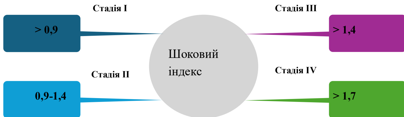
Рис. 1.2. Стадії геморагічного шоку [30]

Таким чином, поєднання гравіметричного методу з оцінкою шокowego індексу підвищує точність діагностики післяпологових кровотеч, сприяє ранньому виявленню критичних станів і дозволяє своєчасно оптимізувати лікувальну тактику.