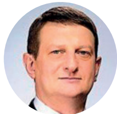
Сорока Іван Миколайович , Президент Українського Медичного Клубу, радник міністра охорони здоров'я України, заслужений працівник охорони здоров'я України