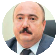
Толстанов Олександр Костянтинович , доктор медичних наук, член-кореспондент НАМН України, проректор з науково-педагогічної роботи Національного університету охорони здоров'я України імені П.Л. Шупика, професор кафедри управління охороною здоров'я та публічного адміністрування, Президент Української Асоціації сімейної медицини